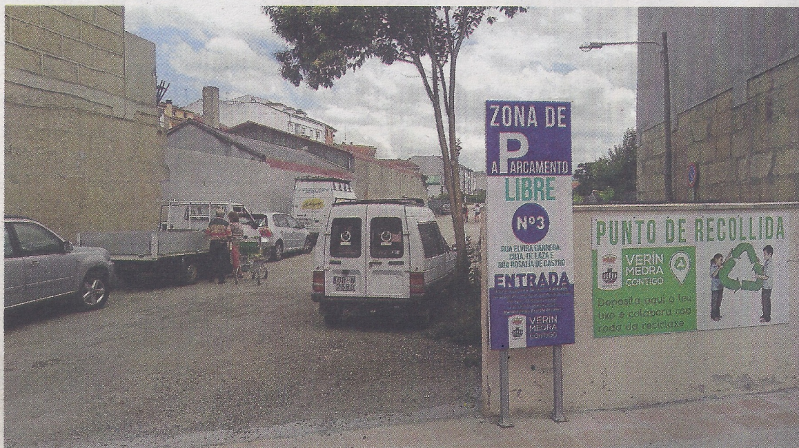
Instantánea del aparcamiento gratuito número tres, entre las calles Rosalía de Castro y Elvira Carrera.