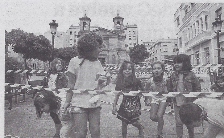
Un centenar de niños del taller de urbanismo se apoderaron del lugar