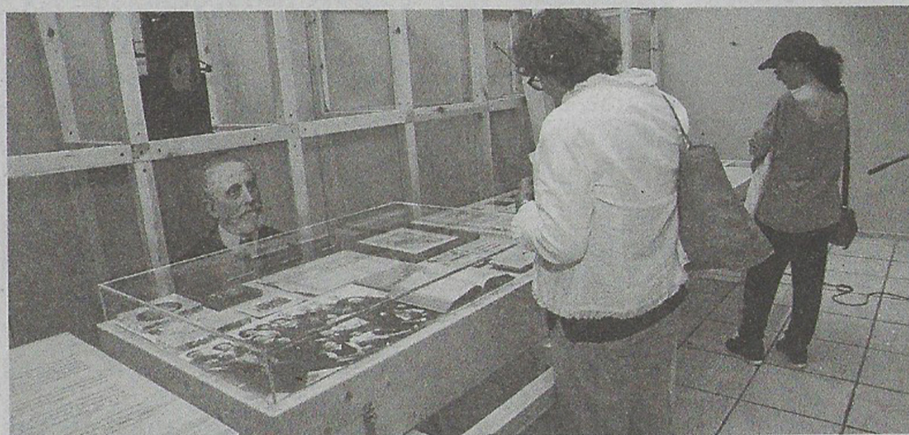
La exposición sobre Casares se puede visitar hasta este fin de semana en el auditorio

A falta de un día para que cierre sus puertas la exposición "Os mundos de Carlos Casares", que se exhibe en la planta alta del auditorio de Ribeira, fueron más de 600 personas las que pasaron por esas instalaciones municipales en la que se muestra un "viaje" por la obra, vida y tiempo del escritor, que fue una figura central para la cultura gallega en el final del siglo XX. Esta colección, que está organizada por la fundación que lleva el nombre del referido autor al que se homenajeó en el Día das Letras Galegas, ofrece