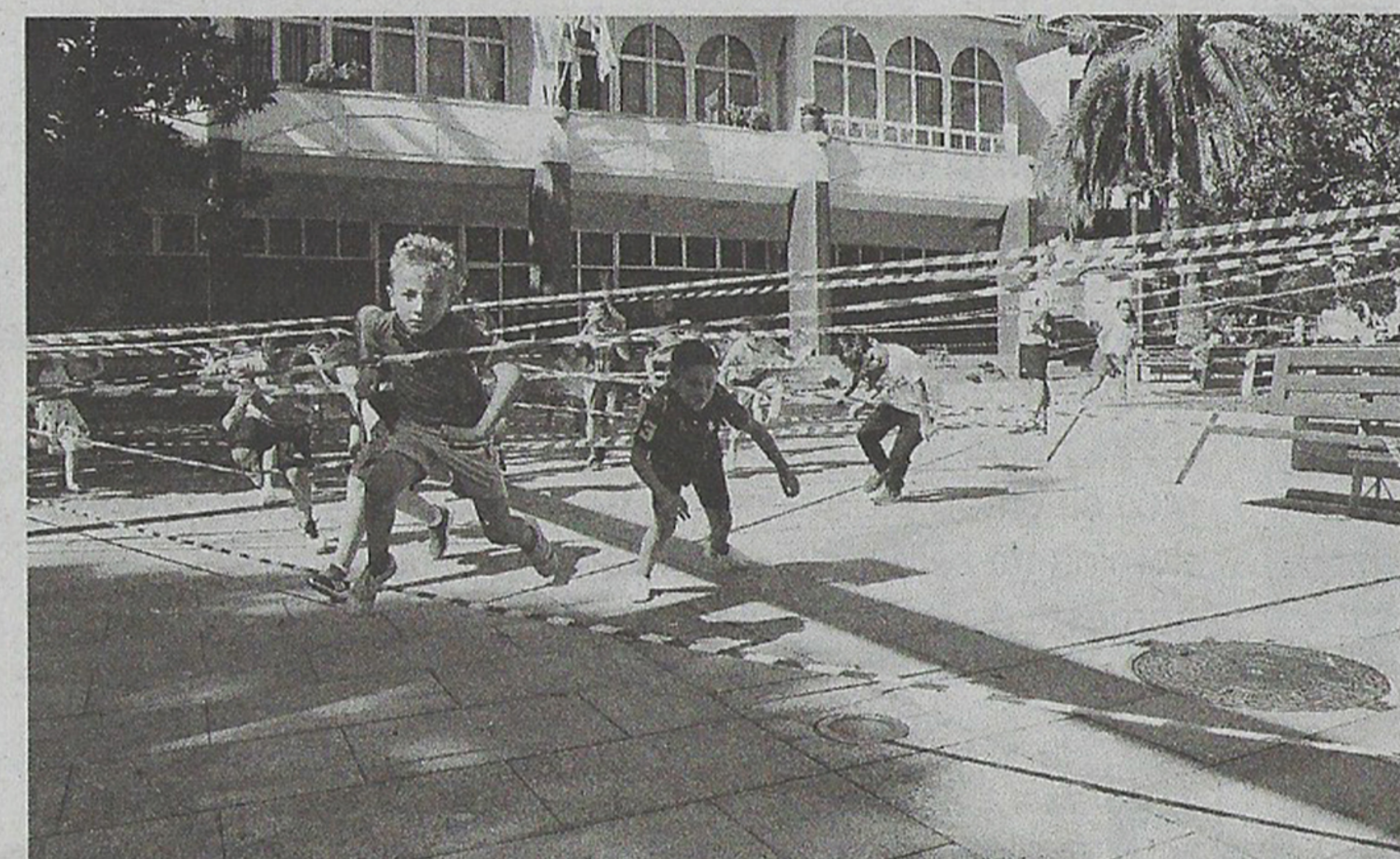
Los niños se desplazaron por la Praza do Concello evitando las cintas de balizaje