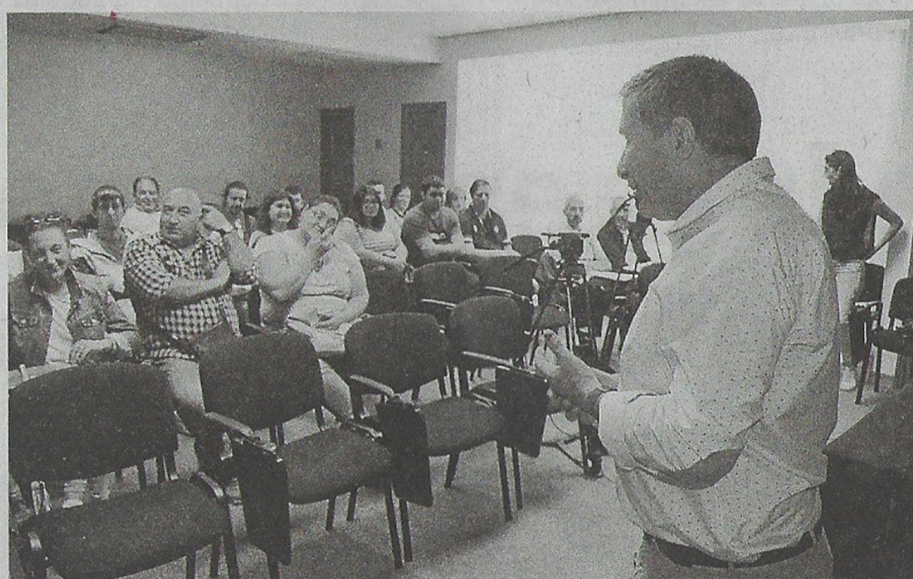
Una veintena de alumnos iniciaron ayer el taller de empleo Tahume 4