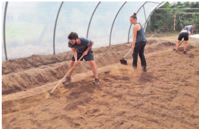
Los voluntarios volverán este verano a realizar trabajos en un invernadero.

A mayores, el proyecto recoge el desarrollo de un programa intergeneracional,