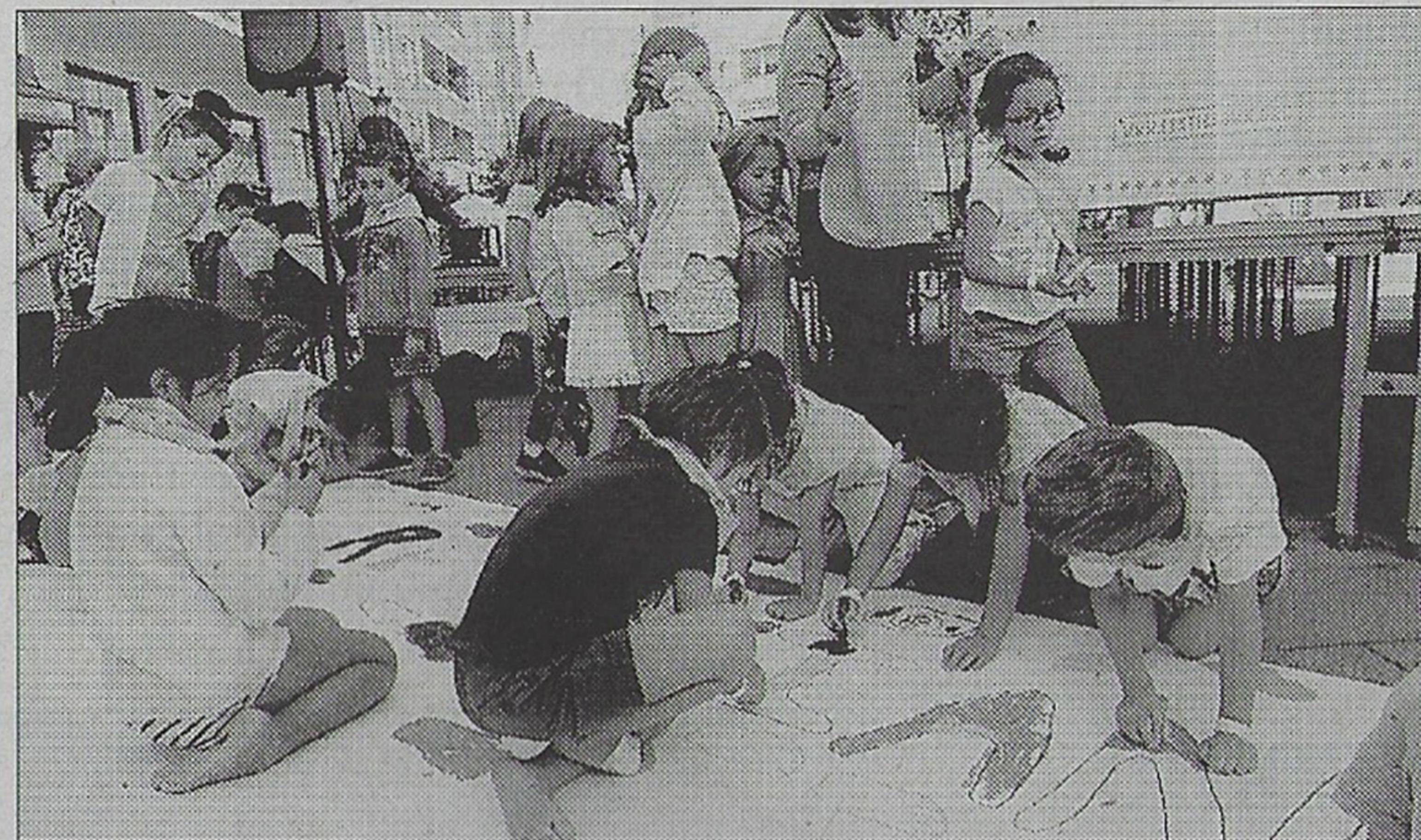
Niños pintan una pancarta en Plaza de Galicia.

Galicia, Amontonados por Azar mostró sus destrezas circenses con su pieza "H2Olga". Una representa-