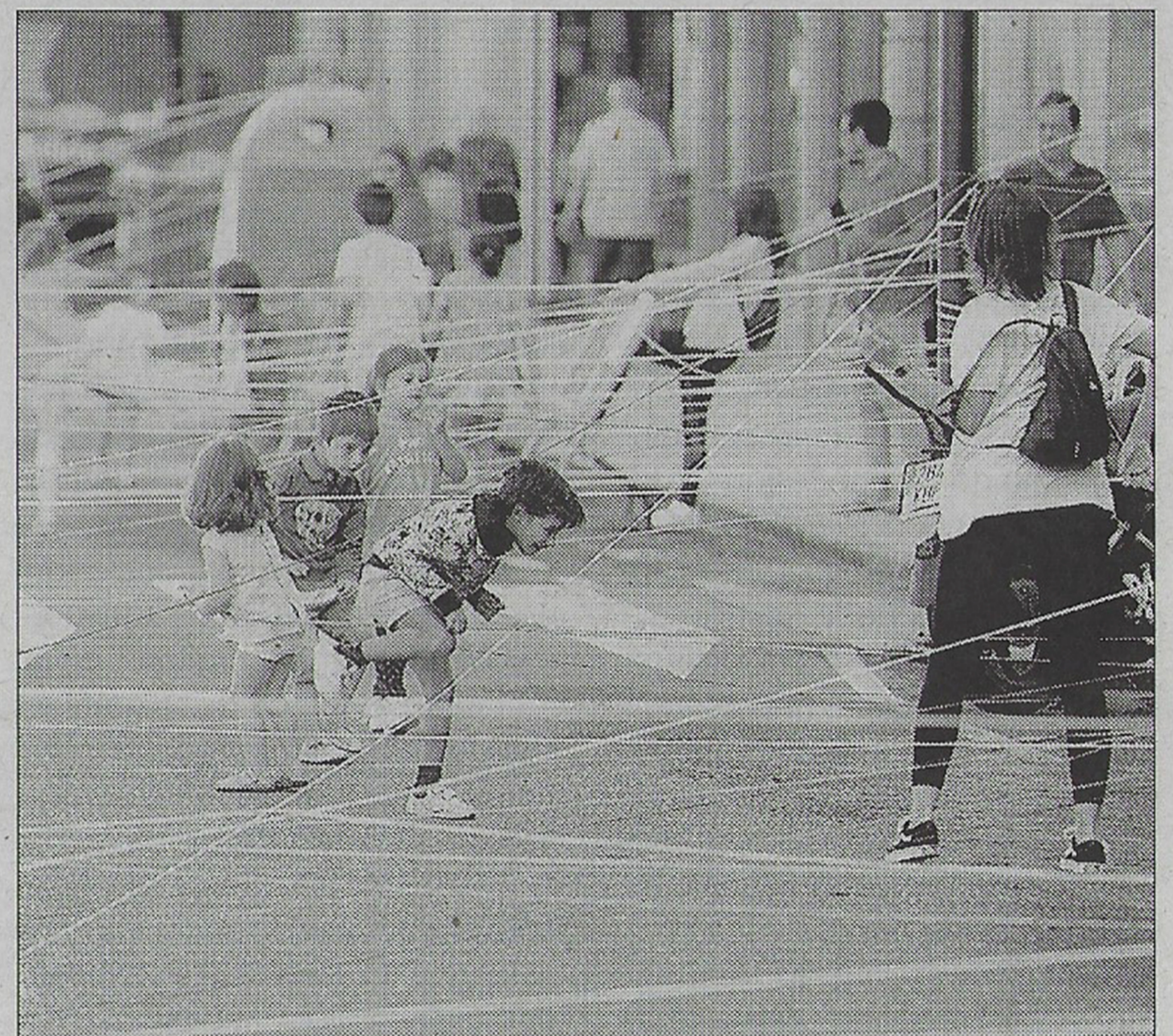
"A Vila do Mañá" se hace con la calle Conde Vallellano.

Durante esta última jornada, se sumarán veinte nuevos monitores a los veinte con los que ya se contaban desde principios de semana.