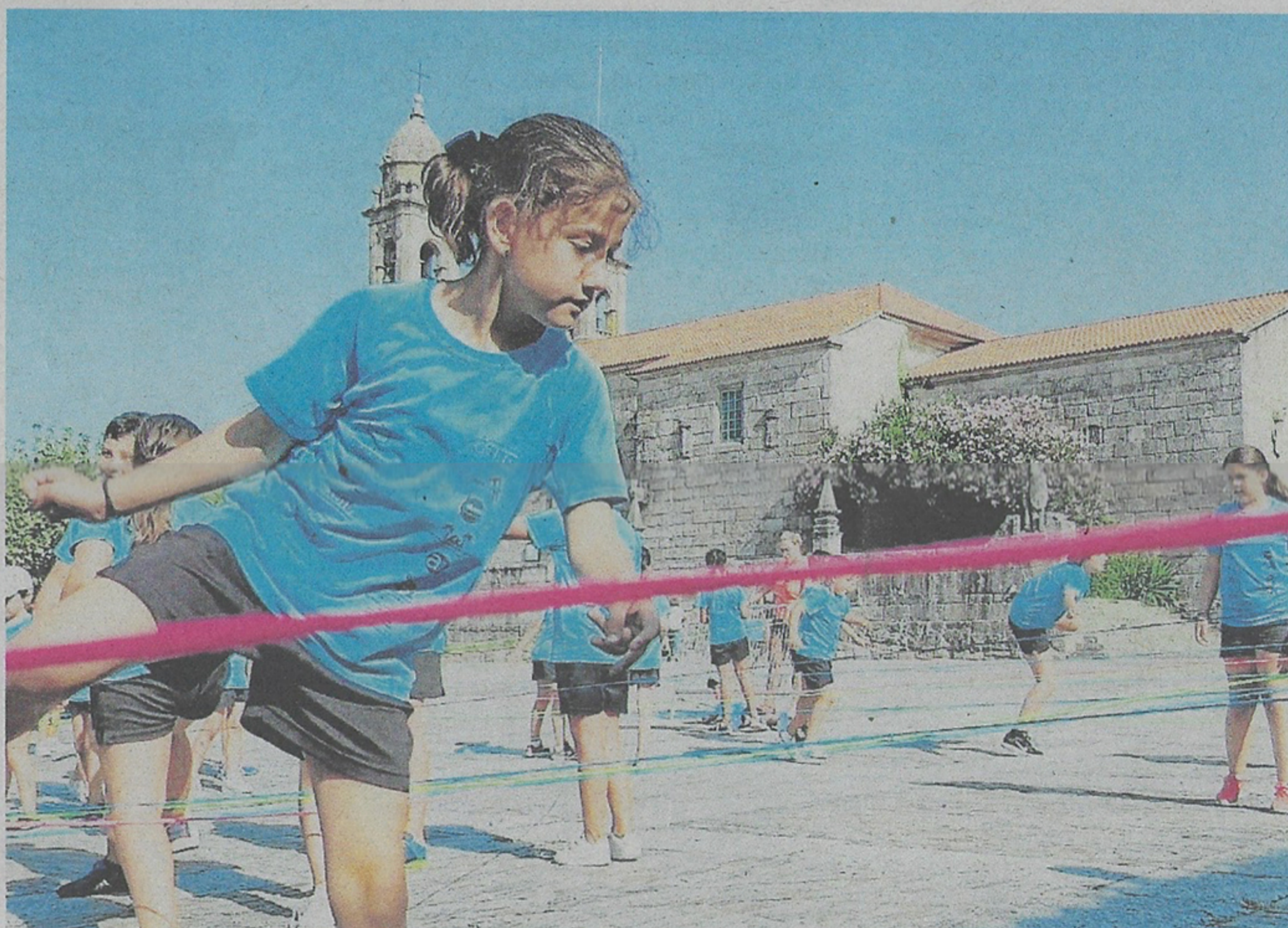
Las actividades lúdicas del programa buscan devolver lugares de las ciudades y pueblos a los peatones

ciadas hace unos meses en el ambulatorio, con un presupuesto de 342.869 euros. Fue el alcalde, Carlos Iglesias, el que interesó la ampliación del proyecto, ante el mal estado del tejado.