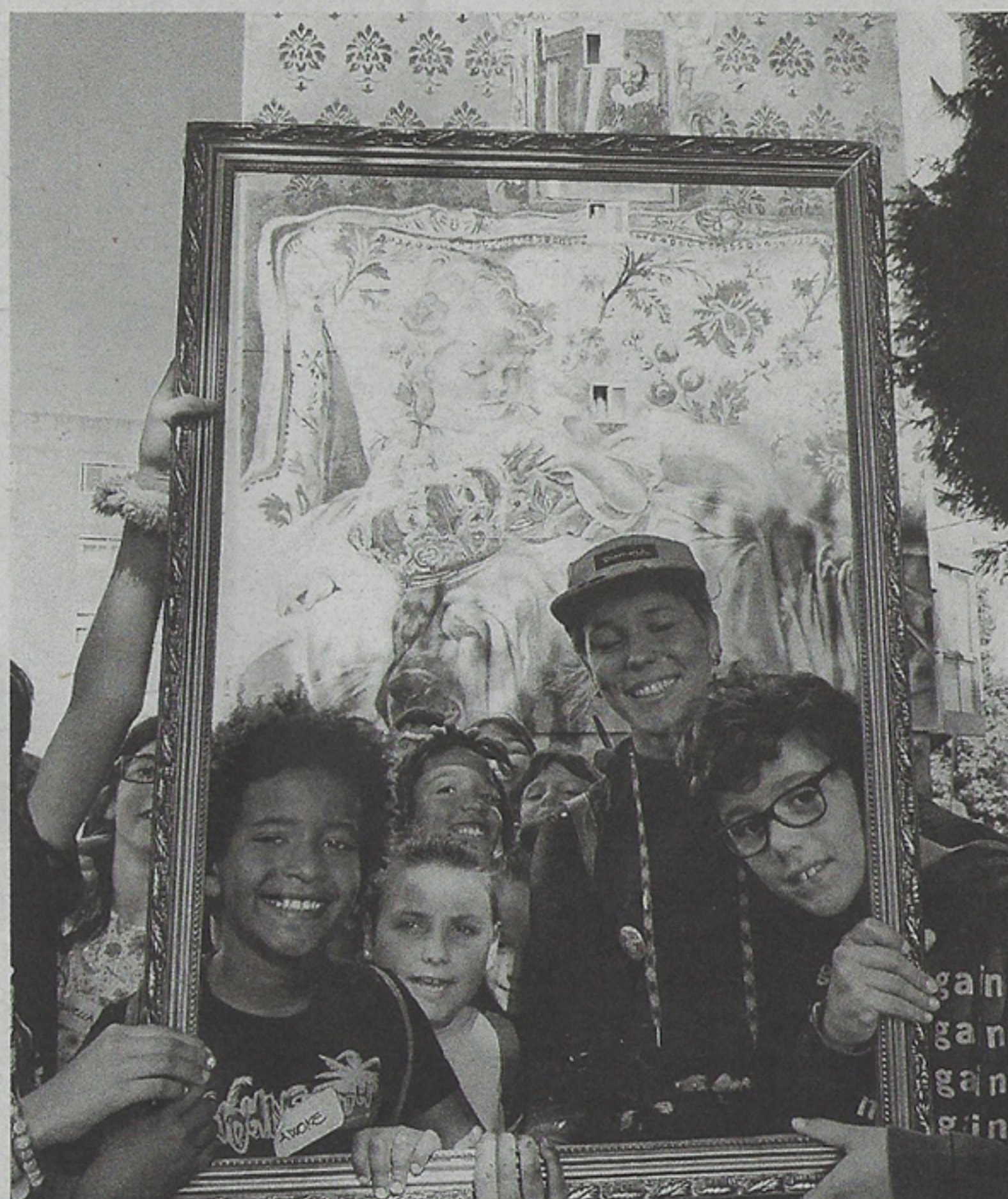
Los niños del taller OUT recorrieron Canido y "enmarcaron" rasgos identificativos

Las propuestas del proyecto "A rúa é túa" se desarrollarán el fin de semana del 21 al 23 coincidiendo con la semana de la Movilidad y Día sin Coches, que se celebra a nivel europeo.