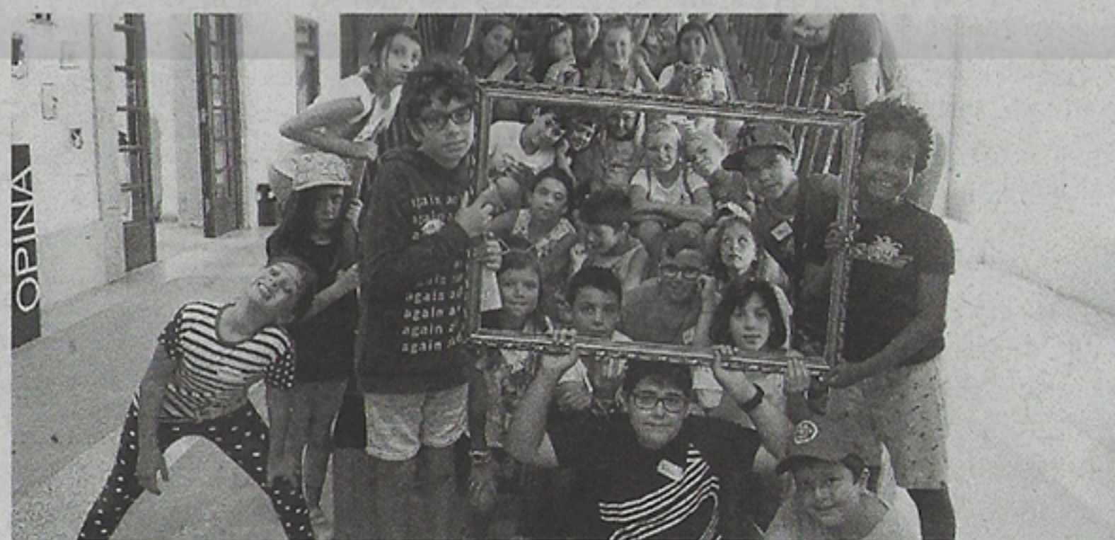
Los niños del "obradoiro" IN realizan actividades en el Torrente Ballester