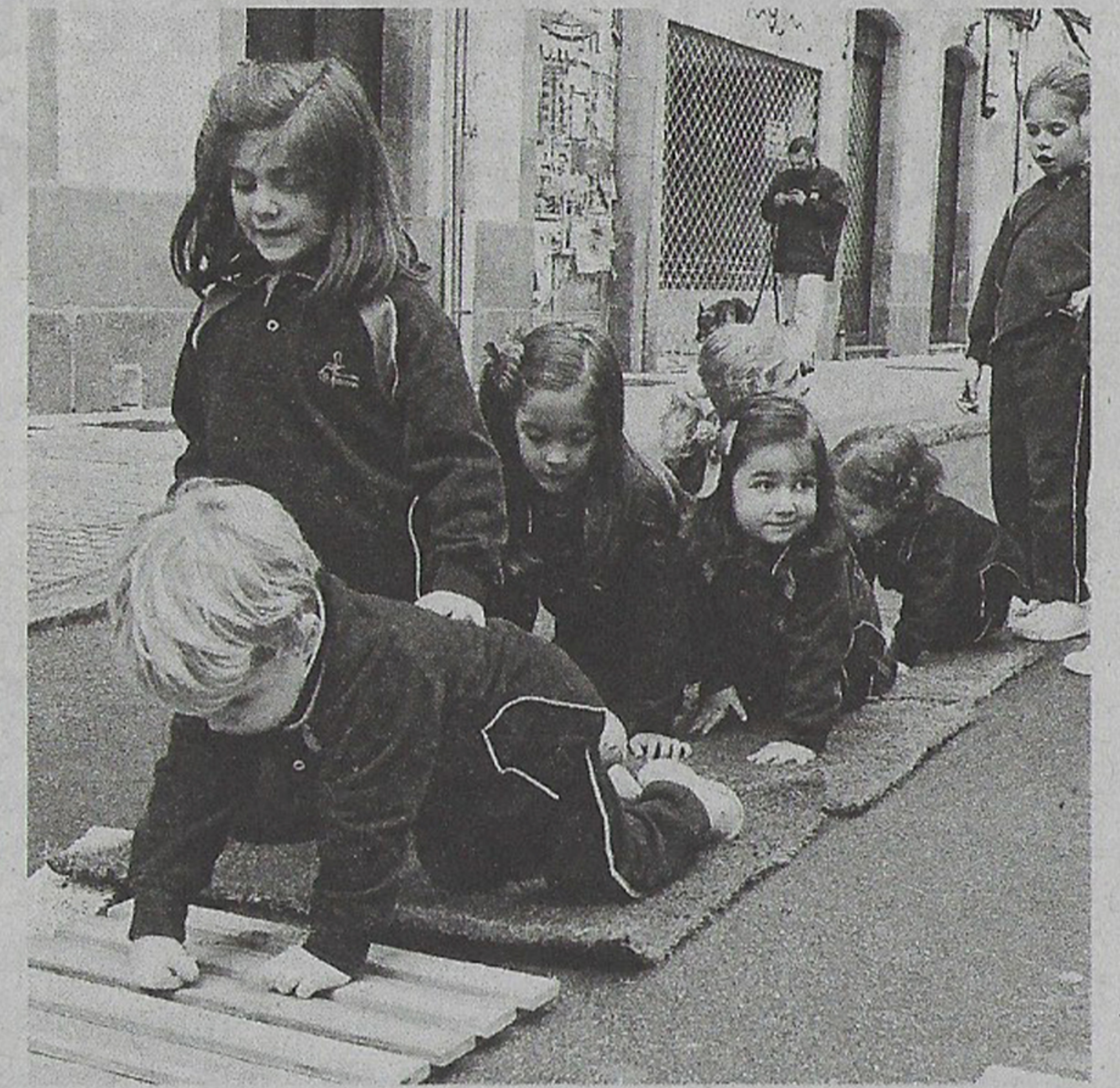
Más de 300 niños y niñas del colegio San Francisco disfrutarán a lo largo de toda esta semana de las actividades que se realizan en las inmediaciones de la Praza da Independencia, cuyas obras de humanización empezarán de forma inminente, según el Concello | MÓNICA FERREIRÓS