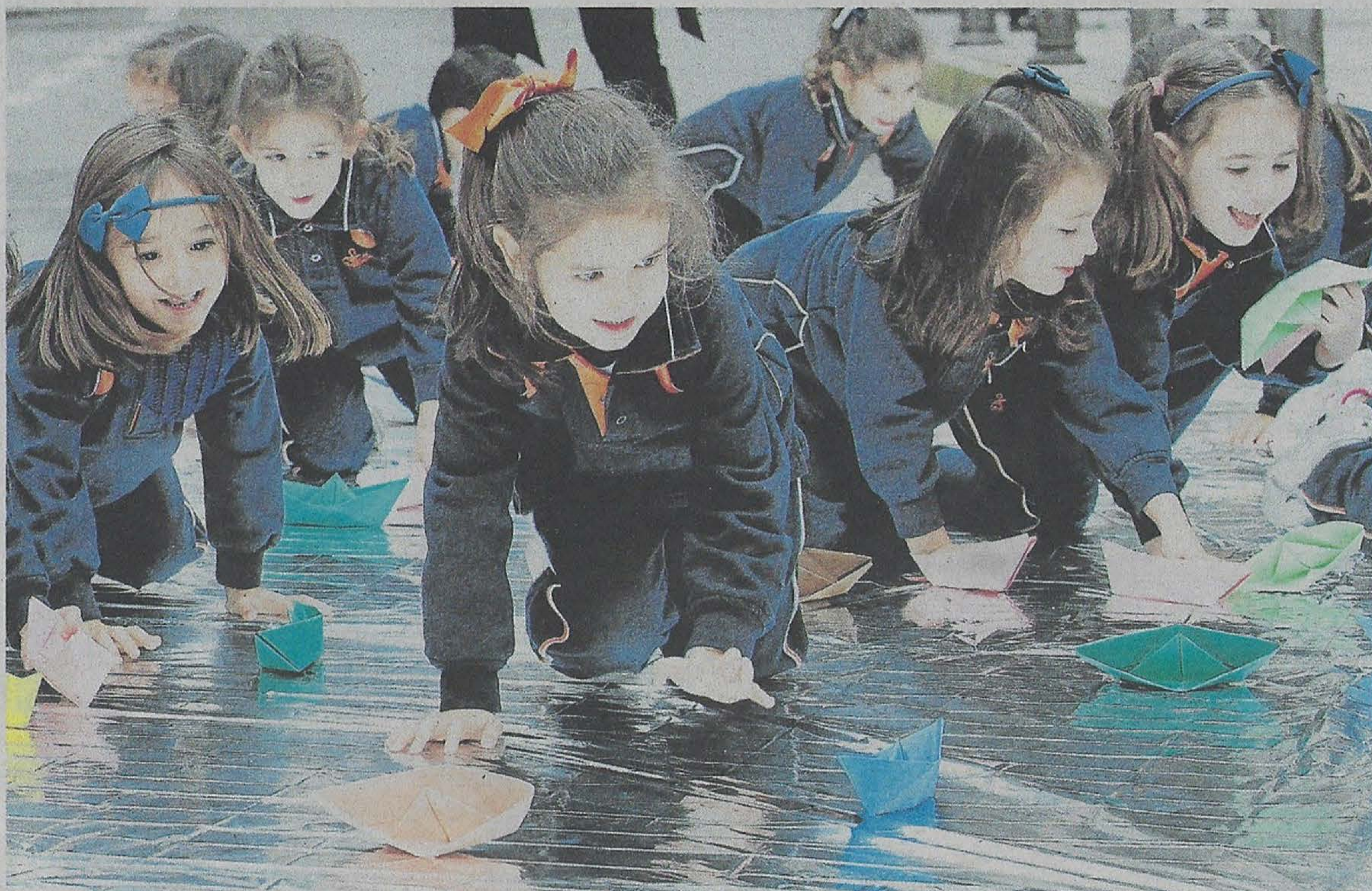
Un total de 340 niños participaron en las actividades de "A vila do mañá" en la Praza da Independencia

[PÁG. 3] El alcalde de Vilagarcía clausuró ayer las actividades de "A vila do mañá", un proyecto incluido en la memoria de los Fondos Feder para dar a conocer las humanizaciones. En unos días comenzará la peatonalización de A Independencia y Varela confía en que el espacio deje de ser una zona "de paso, infrutilizada", para ser tomada por los peatones y, especialmente, por los niños.