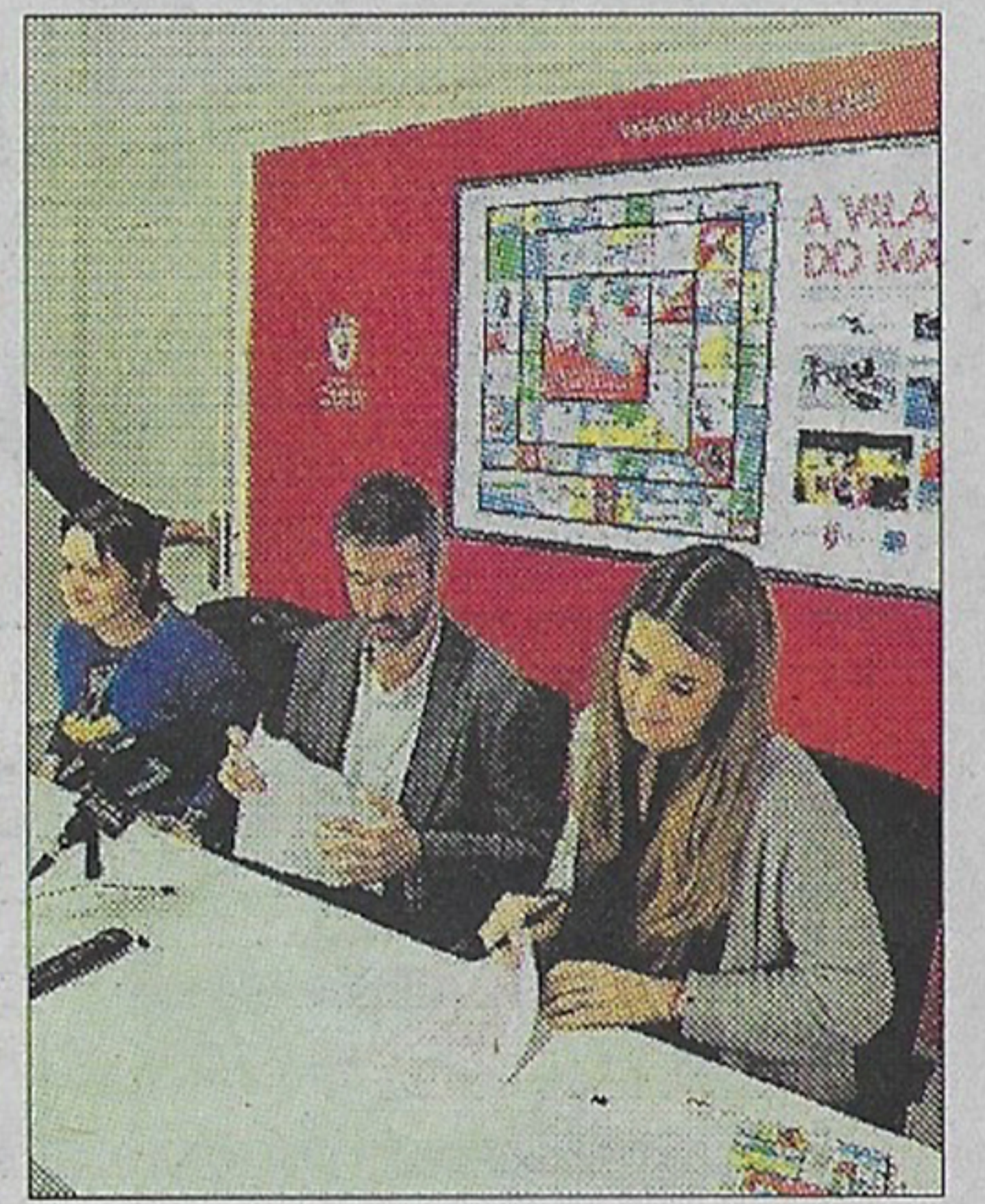
Presentación del libro. // I. A.

Además, la participación está abierta desde los 3 años y habrá diferentes distancias que van desde los 100 metros hasta los 10 kilómetros para los corredores a partir de la categoría junior. La caminata consta de 4,5 kilómetros.