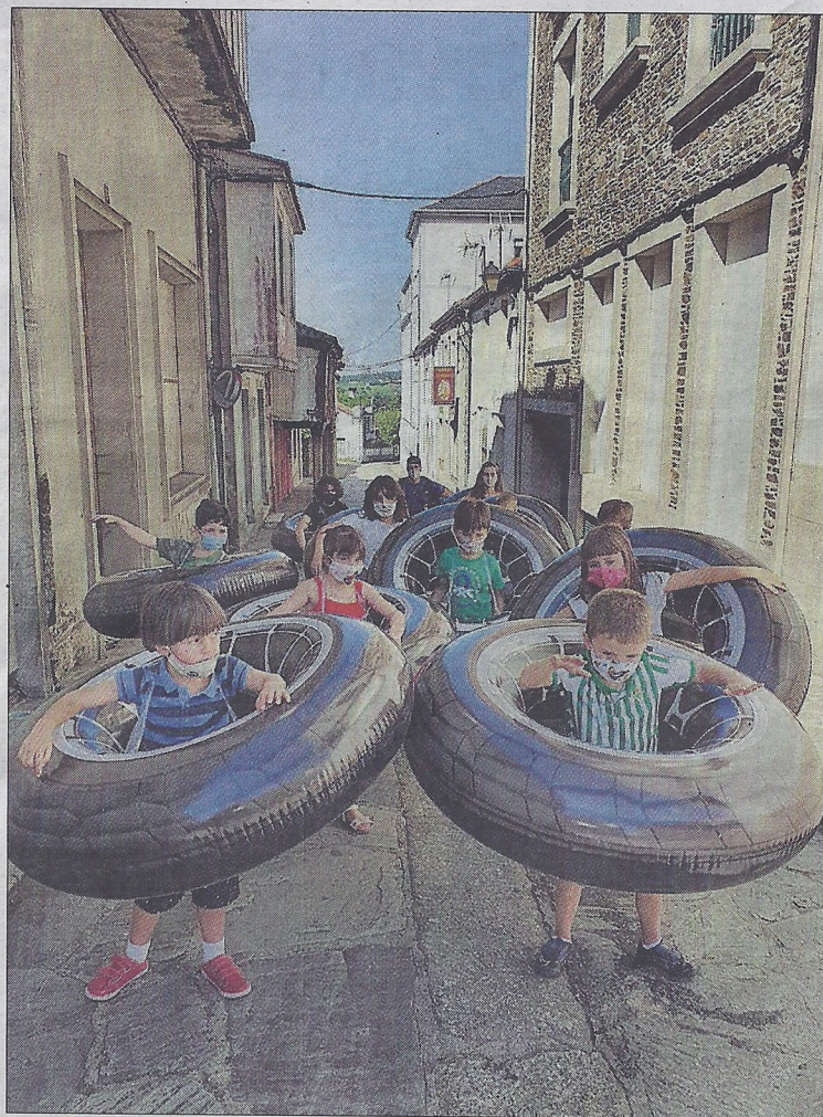
Niños pasean por Arzúa con un flotador para guardar la distancia.

Muchos se sorprendieron al comprobar lo lejos que se encontraban unos de otros. Pero ese no era el objetivo de la actividad, sino saber si las ciudades están preparadas para esta nueva realidad. "En alguna calle pequeña casi ni entrábamos", revela la arquitecta, a la que