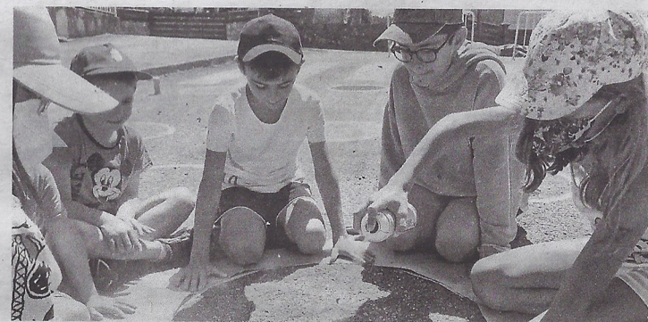
Los niños pintaron con colores fluor el espacio de la entrada del colegio de Asados