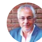
PAU NOY Fundació Mobilitat Sostenible i Segura